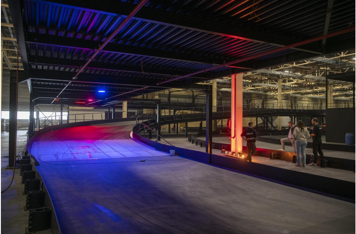
“We zorgen voor de totaalbeleving”, zegt Bonneux.

De rest van de site wordt volledig benut voor alles wat in het teken staat van auto's, vertelt Bonneux. “Op het andere deel van de site is er een tweedehandsshowroom, een carrosserie en zoveel meer.”