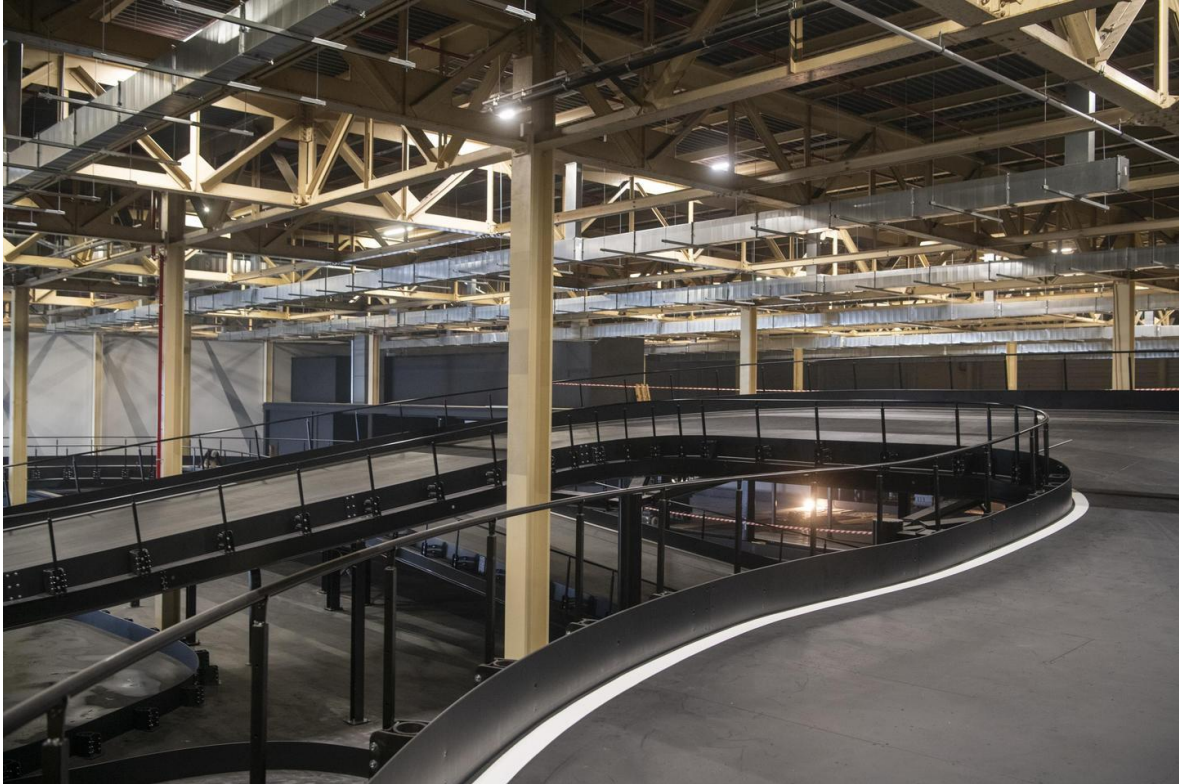
20250424 antwerpen karting evelien bonneux

Niet alleen de look and feel moeten authentiek zijn, ook echte classic cars maken een comeback. "Overal in ons centrum zullen bezoekers allerlei waardevolle wagens zien. In het midden van de bar komen drie carboxen, met daarin unieke wagens. Het draait dus echt om de totaalbeleving."