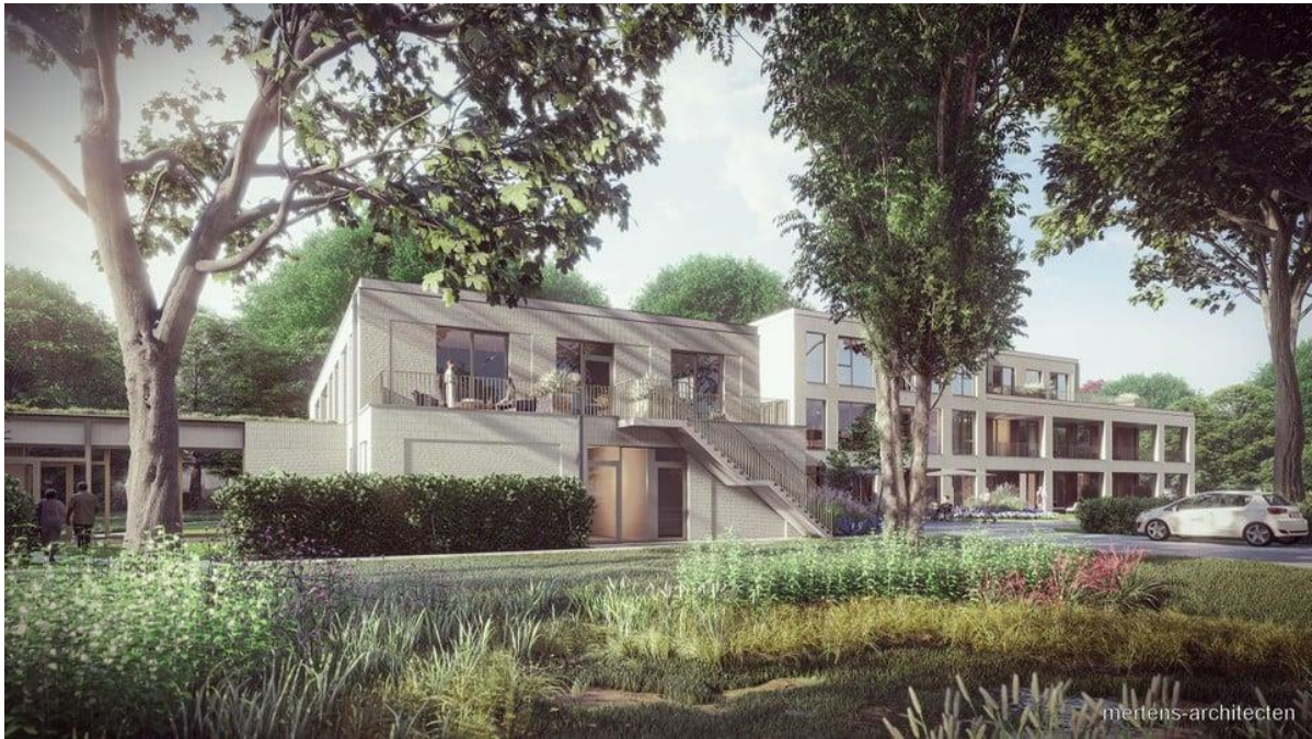
Een aanzicht van hoe de achterzijde er zal uitzien na afwerking in mei 2025. — © Mertens Architecten