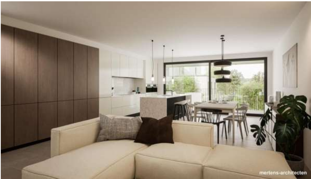
Residentie Veertien