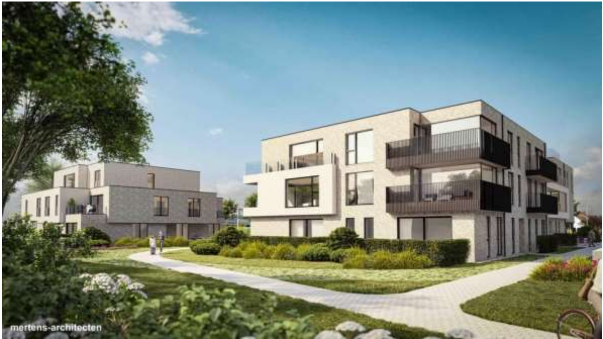
Residentie Veertien