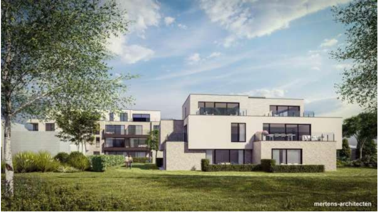
Residentie Veertien.