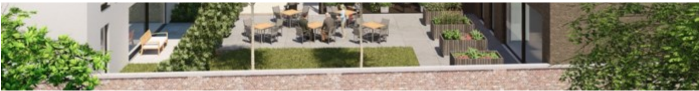
Een 3d-impresie van het project, waarin jong en oud samen een plaats krijgen.

MEISE - Er is een akkoord tussen de chiro, het jeugdhuis en de ontwikkelaar van de 33 assistentiewoningen in Meise-centrum. Aanvankelijk was er veel protest tegen het project, maar er is een aangepast plan en de promotor investeert fors in de jeugdlokalen.