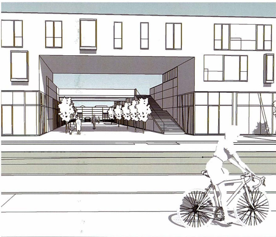
De commerciële ruimten met appartementen.