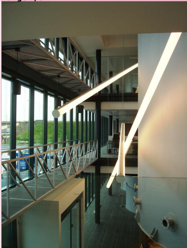
Van op de eerste verdieping heb je een mooi uitzicht op de centrale tank en de loopbrug. vorige 5/5