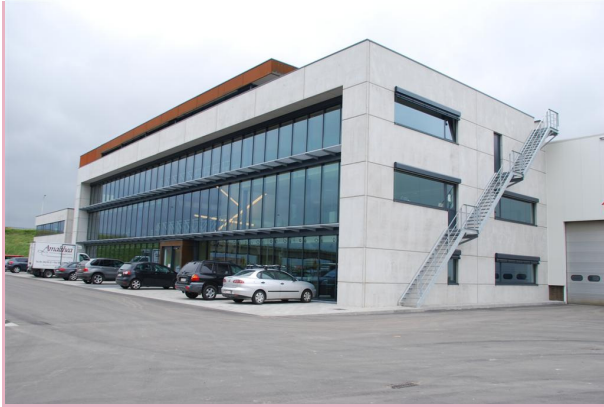
Het nieuwe gebouw bezit een vloeroppervlakte van 2.400 m 2 . vorige 4/5